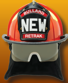
Pantalla ReTrak en posición de despliegue