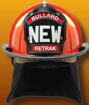
Pantalla ReTrak en posición de recogida